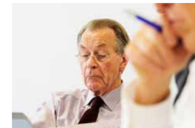
Gremiensitzung mit dem Kuratoriumsvorsitzenden Franz Müntefering

Die Zusammenfassung der Diskussion gebührte Franz Müntefering: Die Finanzierung von Präventionsmaßnahmen müsse politisch verankert sein, so der Kuratoriumsvorsitzende in seinem Podiumsbeitrag: „In Prävention investiertes Geld ist sinnvoll angelegt – diese Erkenntnis setzt sich immer mehr durch. Seit 2016 sorgt ein Präventionsgesetz für eine finanzielle Basis. Allerdings dienen die Beträge in der Hauptsache der Krankheitsprävention. Sportunfallprävention ist im Gesetz derzeit noch nicht berücksichtigt. Dabei wissen wir: Unfallverhütung ist machbar. Wir brauchen „Prävention durch Sport“, weil Sport ein tolles Mittel ist, um jung, gesund und beweglich zu bleiben, und „Prävention im Sport“, damit nichts dabei passiert.“