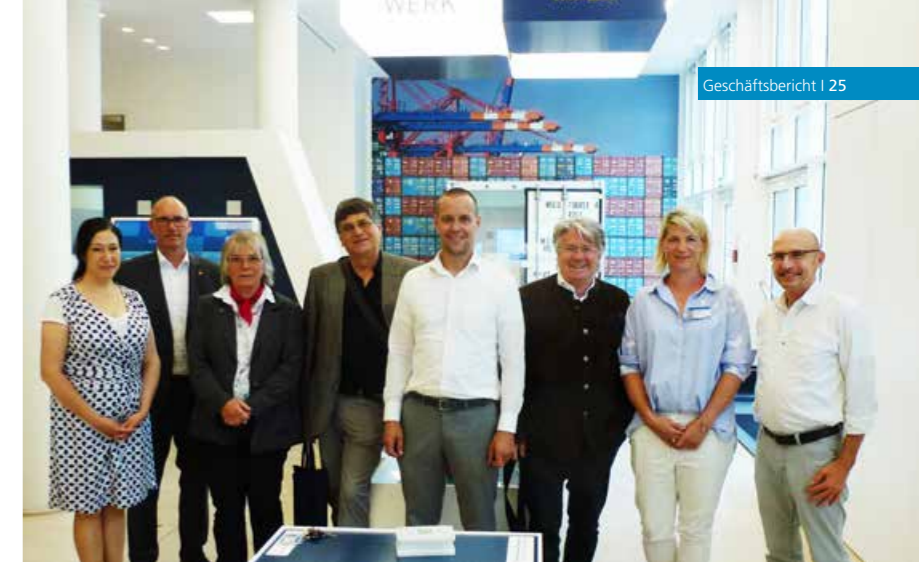
Nach unserer Auftaktsitzung: Die Teilnehmer des Arbeitsausschusses „Pferdesport“ im DIN.