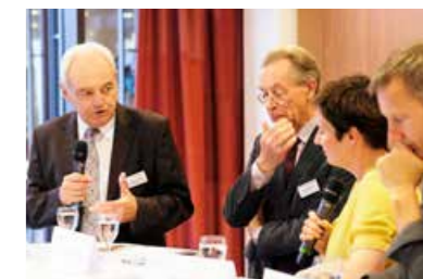
Walter Schneeloch, Präsident des Landessportbundes NRW und Vizepräsident des DOSB, sprach zur Rolle der Sportverbände.