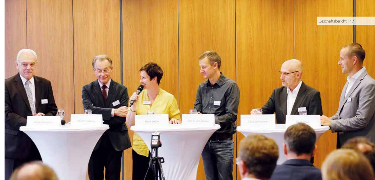
Wissenschaft, Politik und Sportverband: Gemeinsam diskutierten die Podiumsteilnehmer zum Start der 15. Internationalen DACH-Tagung über Aspekte der Sportunfallprävention.